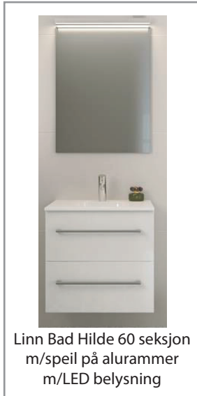
Linn Bad Hilde 60 seksjon m/speil på alurammer m/LED belysning