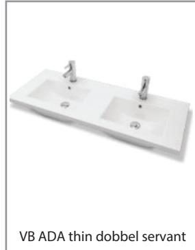
VB ADA thin dobbel servant