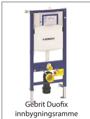
Geberit Duofix innbygningsramme