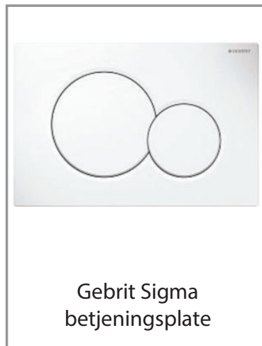
Geberit Sigma betjeningsplate