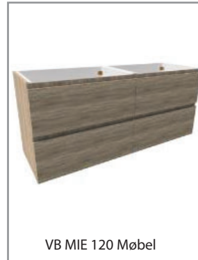
VB MIE 120 Møbel