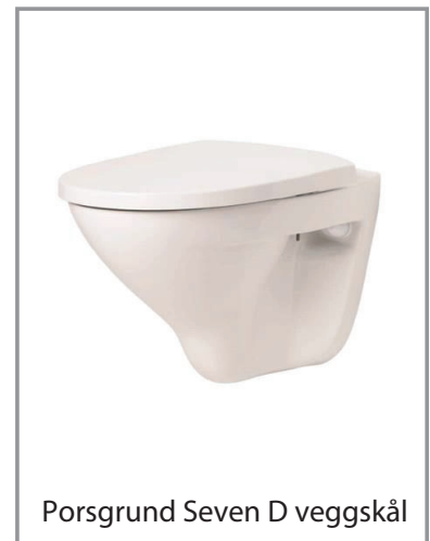
Porsgrund Seven D veggskål