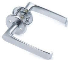
Sletten innerdør Innvendig vrider id nr. 1 (Illustrasjonsbilder fra Bygg 1)